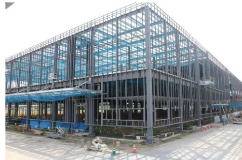
現在の建物の様子

【上棟式とは】建物の造営が成就した際に執り行われる建築儀礼です。ボルトとナットを使い、鉄骨に締め付け、締めた鉚をハンマーで叩いて確認をします。その後、鉄骨を吊り上げて所定の設置に取り付ける儀式となります。