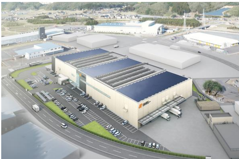
ヘルスケアフードファクトリー関東完成予想図