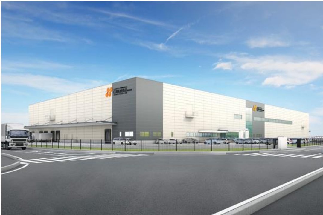
ヘルスケアフードファクトリー関東完成予想図

病院・介護福祉施設での食事提供サービス会社である日清医療食品株式会社（本社：東京都千代田区、代表取締役社長：菅井正一 以下「日清医療食品」）は、3月8日に栃木市千塚に新設するヘルスケアフードファクトリー関東の建設工事に関する契約について古久根建設株式会社、三菱ケミカルエンジニアリング株式会社と合意式を実施いたしましたのでお知らせいたします。