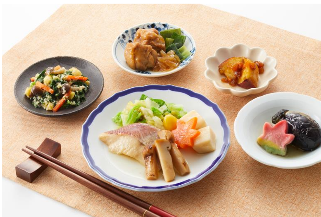
※写真は「姫鯛と松茸の柚子風味蒸し」

病院・介護施設での食事提供サービス会社である日清医療食品株式会社（以下「日清医療食品」とする）は、2020年8月20日から食宅便「秋の実り膳」を販売いたします。