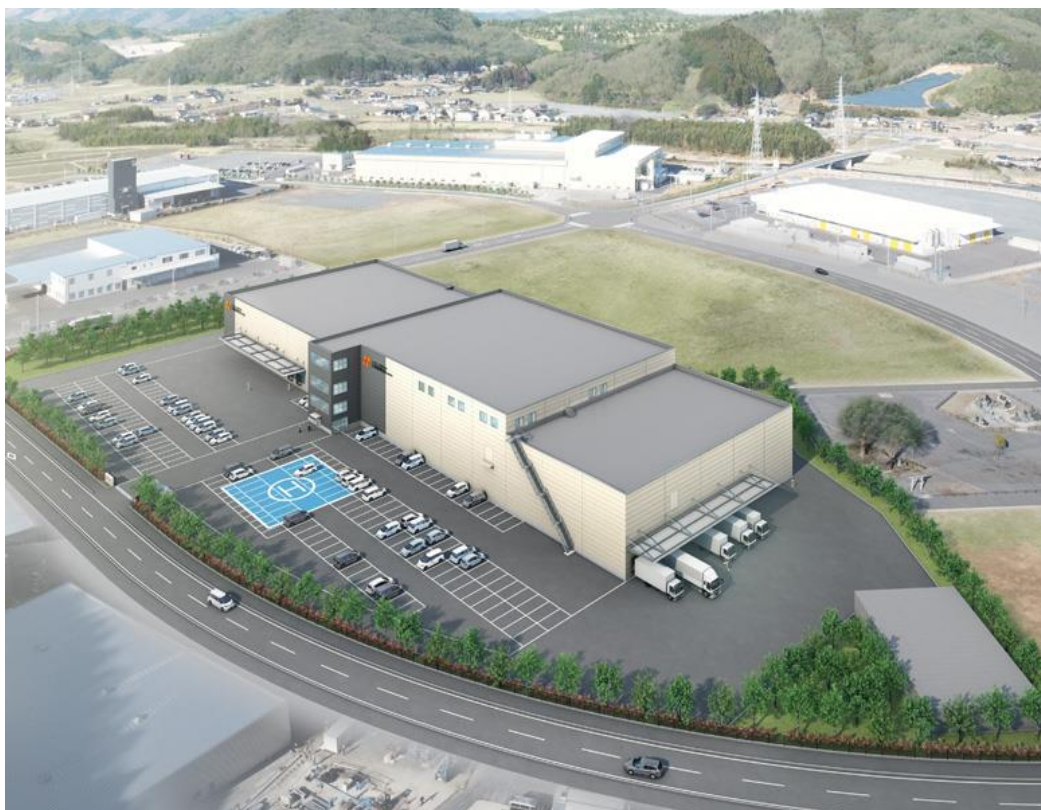
ヘルスケアフードファクトリー関東（仮称）完成予想図