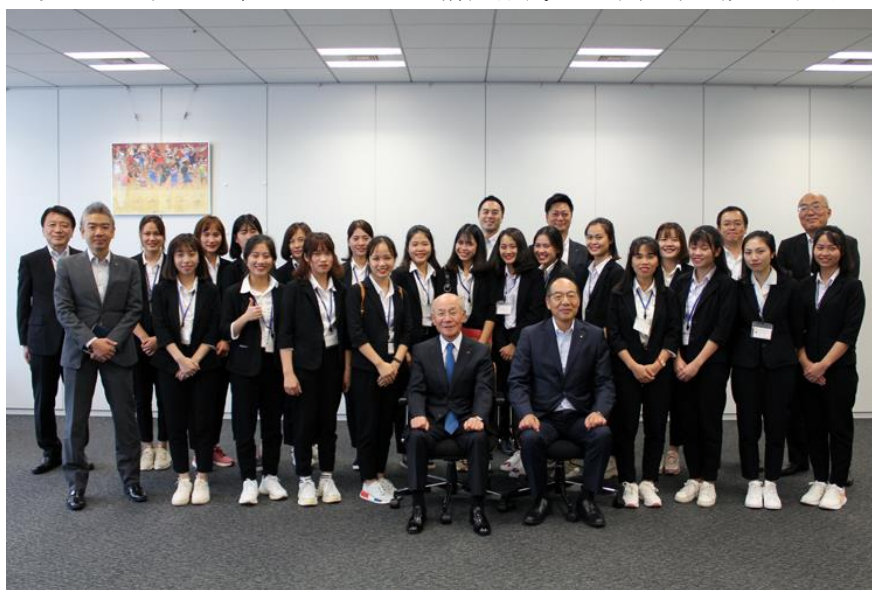
※本社にて実施した歓迎会での記念写真

7 月 1 日の受入れに先立ち、6 月 12 日に日清医療食品の本社等で歓迎会を実施いたしました。