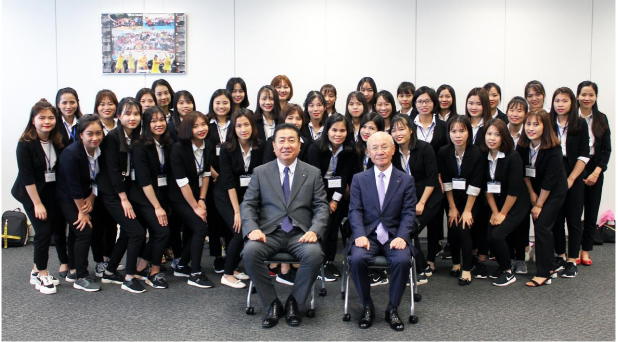
※本社にて実施した歓迎会での記念写真