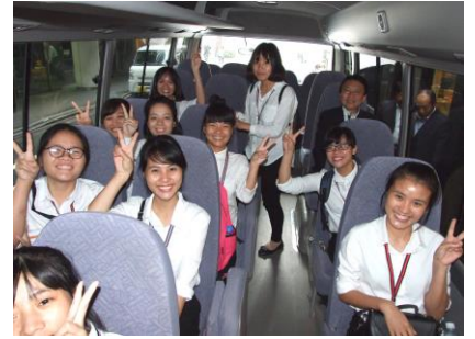
慣れないバスでの移動