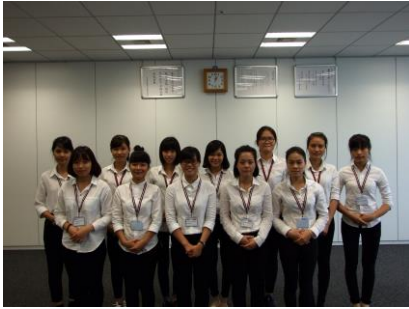
本社での集合写真

日清医療食品が手掛けるムース食を使った料理、デザートを食べていただくことで緊張も和らぎ、日本での勤務に向けての決意が固まった様子でした。